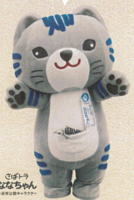
さびトラ ななちゃん 小浜市立図書館

※写真、イラストはイメージです。 ※屋台村のメニューは変更になる場合があります。