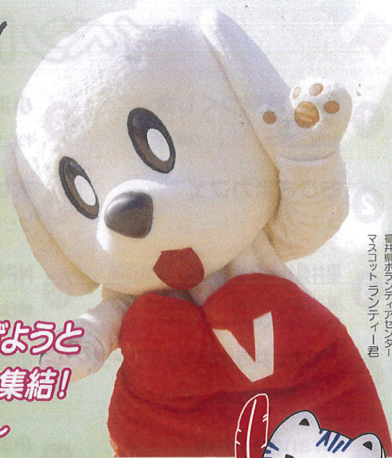
福井県ホフティアセンター マスコットフンディー君